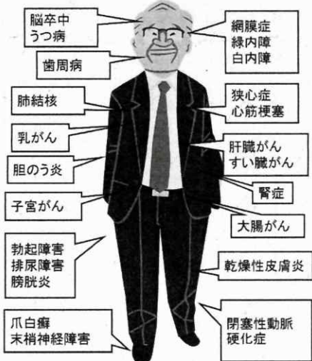
全身に起こる糖尿病の合併症

糖尿病にはたくさん合併症があります。これまでご紹介した網膜症、神経障害、腎障害、心筋梗塞、狭心症、脳卒中や閉塞性動脈硬化症、さらに歯周病、認知症、がんの